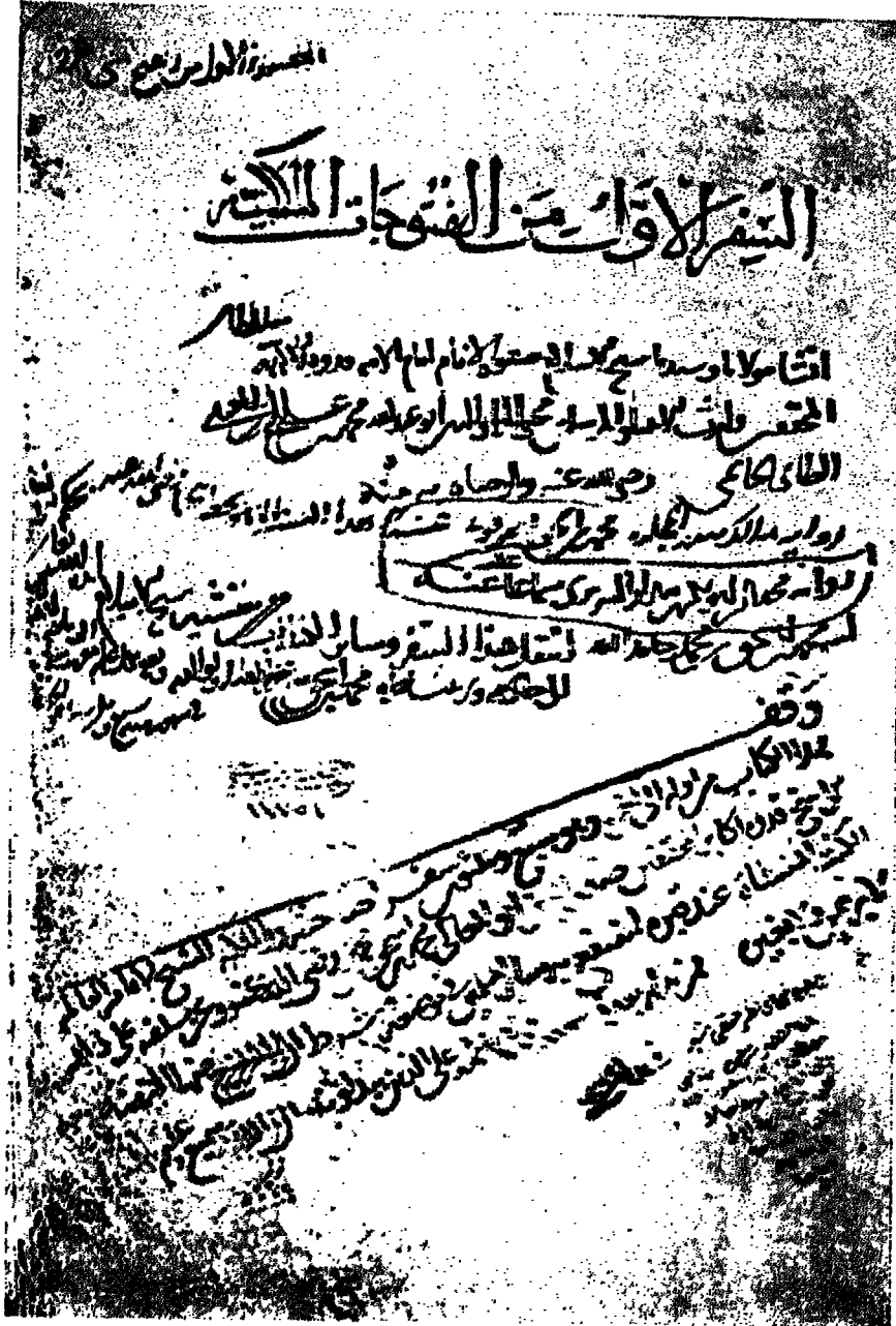
مخطوط قونية (متحف الآثار الاسلامية باستانبول) رقم ١٨٤٥ وهو الاصل الام للنسخة الثانية للفتوحات ، عام ٦٣٦ هـ